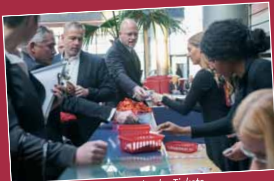
Reges Treiben bei der Ausgabe der Tickets