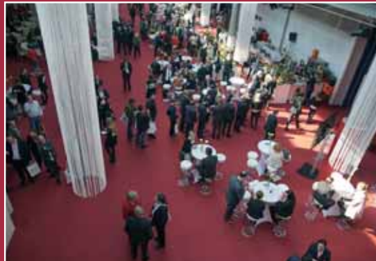
Blick auf den Netzwerk- und Cateringbereich